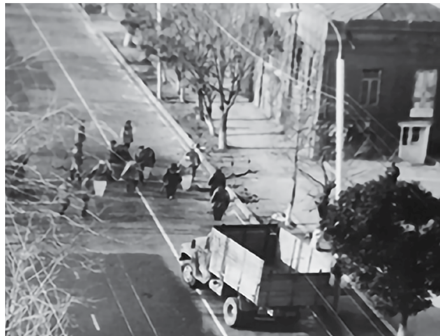
Фрагмент следственного эксперимента – реконструкция наезда автомобины ЗИЛ-130 на десантников на месте происшествия с использованием ростовых мишеней

На третьем этапе было выполнено моделирование взаимного расположения автомобиля и дерева в момент контакта и остановки по следам, оставшимся от этого контакта как на автомобиле, так и на дереве. Это моделирование зафиксиро-