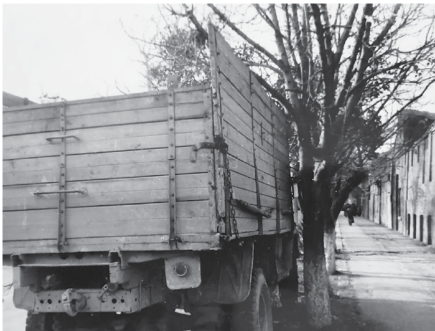
Положение а/м ЗИЛ-130 в момент контакта с деревом у дома №39 по ул. Джапаридзе

40 км/час, место травмирования военнослужащих, оказавшееся на отметке 80-82 м по оси С, место попытки его остановки свидетелями К.В. Гришиным и В.Н. Поповым, которое оказалось на отметке 102-104 м по оси С, то есть на расстоянии 20 м за местом наезда и травмирования военнослужащих, дальнейший маршрут движения автомобиля после наезда на военнослужащих до его остановки, а также место остановки автомобиля у расположенного на газоне дерева, соответствовавшее отметкам 128-130 м по оси С.