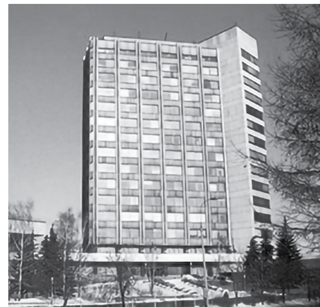
Здание Гохрана Российской Федерации в Москве

Одним из самых закрытых учреждений бывшего Советского Союза и пришедшей ему на смену Российской Федерации по праву можно признать так называемый «Гохран» – Государственное хранилище ценностей. Создано оно было специальным Постановлением Совнаркома РСФСР от 3 февраля 1920 г. в составе Наркома финансов РСФСР; впоследствии его название неоднократно менялось.