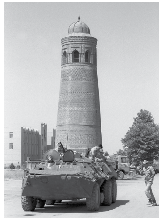
Советские войска охраняют Узген, 1 июля 1990 г.

человек, которая стала возмущаться тем, что якобы в местной больнице узбеками убиты находившиеся там на лечении киргизы. 5 сотрудников милиции пытались сдерживать их на мосту и вести разъяснительную работу. Отвезли группу делегатов в больницу и показали, что там нет ни раненых, ни убитых.