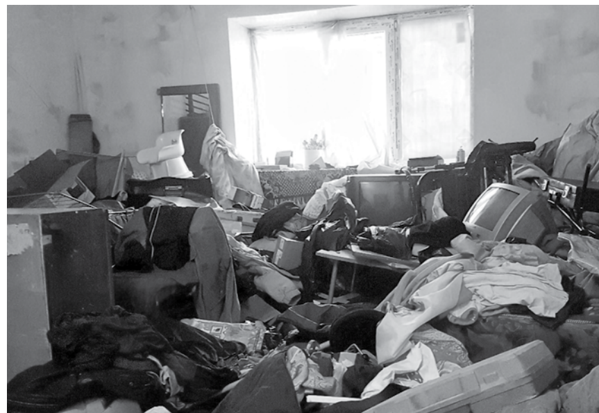
Место происшествия – обстановка в доме