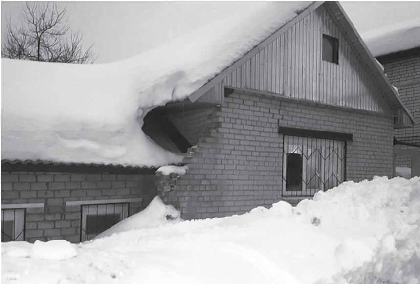
Дом, где были обнаружены тела женщин