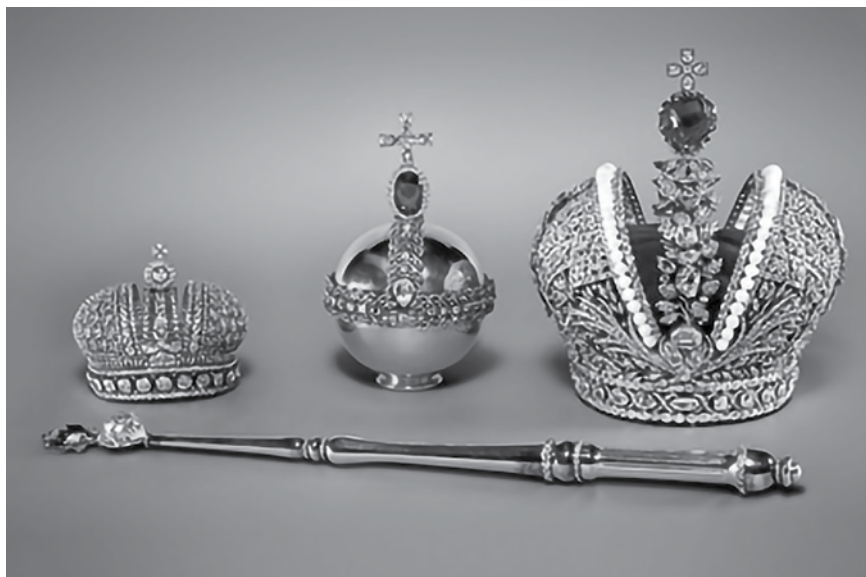
Коронационные регалии Алмазного фонда, Гохран РФ

При образовании Гохрана наибольший объем поступлений составляли ценности, конфискованные у частных лиц, банков и других учреждений, а также принадлежавшие ранее Российской короне. Сюда же поступали наиболее ценные иконы и предметы богослужебного характера, изъятые у Церкви. В Гохране всё это «добро» оценивали и тщательно обезличивали, уничтожая доказательства принадлежности конкретным владельцам. Многие из этих артефактов по решению Совета народных комиссаров (СНК) РСФСР в 1920-1930 годы были проданы на зарубежных аукционах. В том числе уникальные предметы из знаменитой Бриллиантовой комнаты Зимнего дворца Санкт-Петербурга.