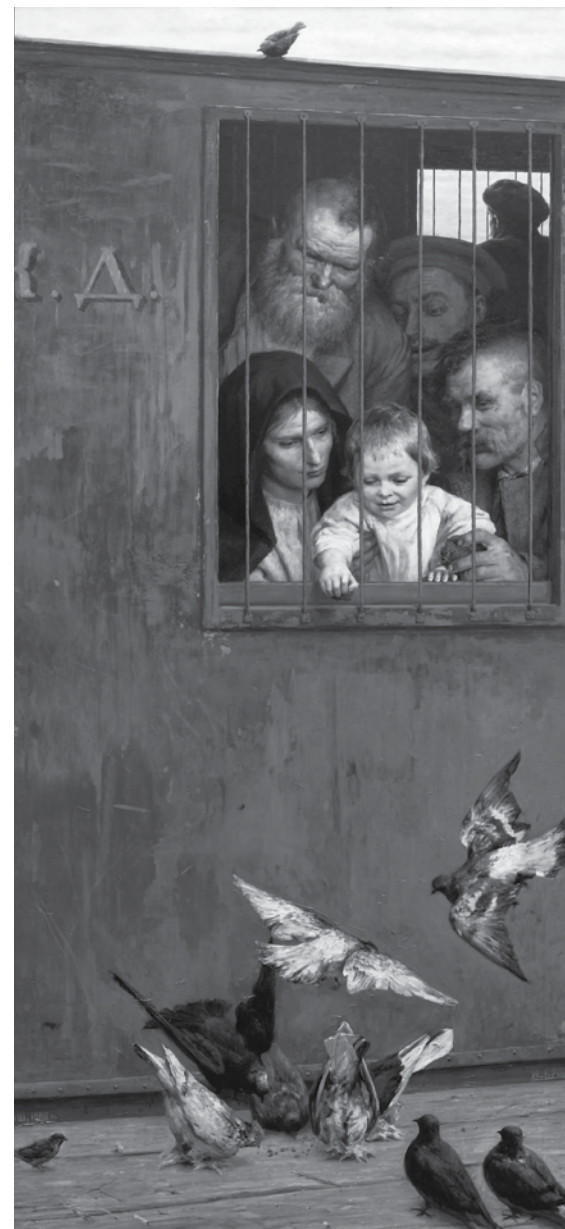
Николай Ярошенко. Всяду жизнь